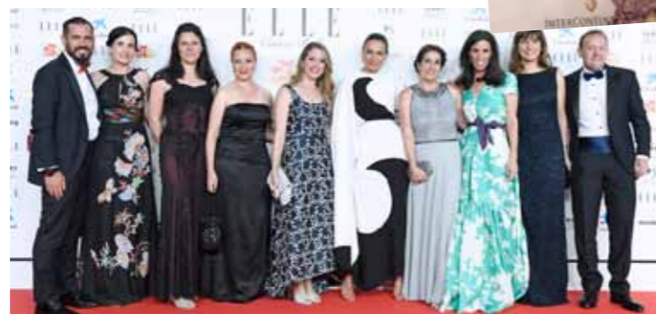
La recaudación de esta iniciativa de la revista Elle estuvo destinada íntegramente a CRIS.

que aportaron su granito de arena para ayudar en la investigación contra esta enfermedad.