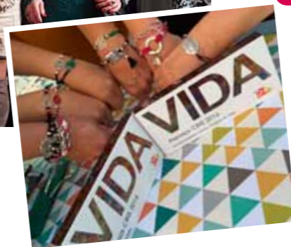
Las mujeres taxistas han recaudado este último año 62.000 euros, que donaron a CRIS Contra el Cáncer.