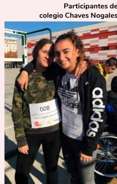
Participantes del colegio Chaves Nogales.